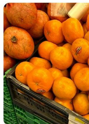
En del frukt og sjokolade er blant varene som fikk kraftigst prisøkninger i 2025.