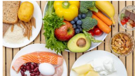
Kostrådene kan gi lavere mat- og drikkekostnader for menn, men litt mer for kvinner, viser undersøkelsen.

Den hypotetiske familien besto av en voksen kvinne, en voksen mann, en gutt på 13