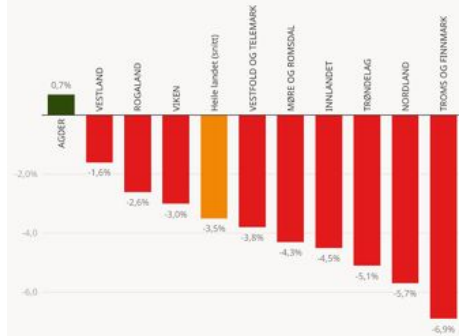
Grafikk: Sjarne Bekkeheim Aase, Nationen