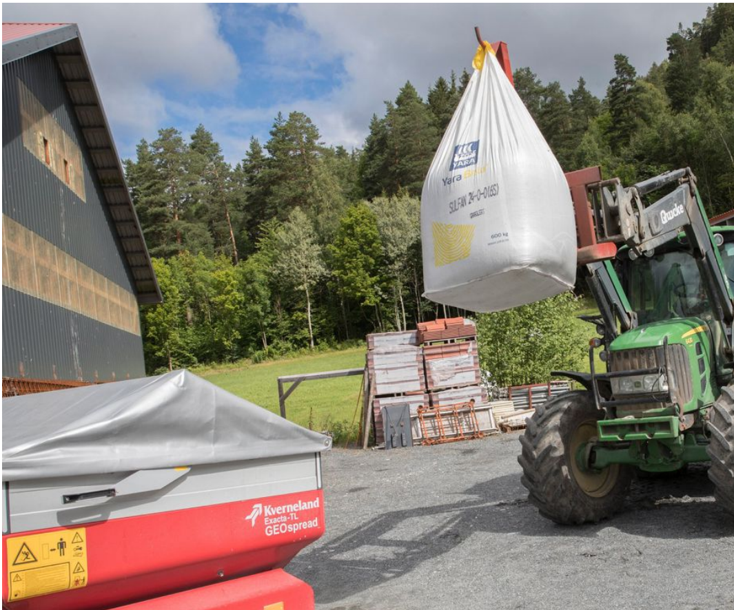
Stor prisvekst på flere viktige driftsmiddel i jordbruket får konsekvensar, ifølgje analytikar.