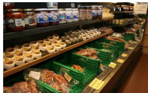
Kraftig kostnadsvekst for bønder kan i neste omgang føre til større prisvekst på matvarer, ifølgje analytikar.

rektoratet trekt fram at auka råvareprisar på mellom anna raps, roesnittar og feitt har verka inn fortel Finci.