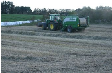
Prisen på diesel er ein av innsatsfaktorane i jordbruket som har auka mest, men nå er det teikn til nedgang.

Prisane på viktige innsatsfaktorar i jordbruket held fram med å gå ned. Særleg ein tung kostnad drar motsett veg. Slik ser analytikar på vegen vidare.