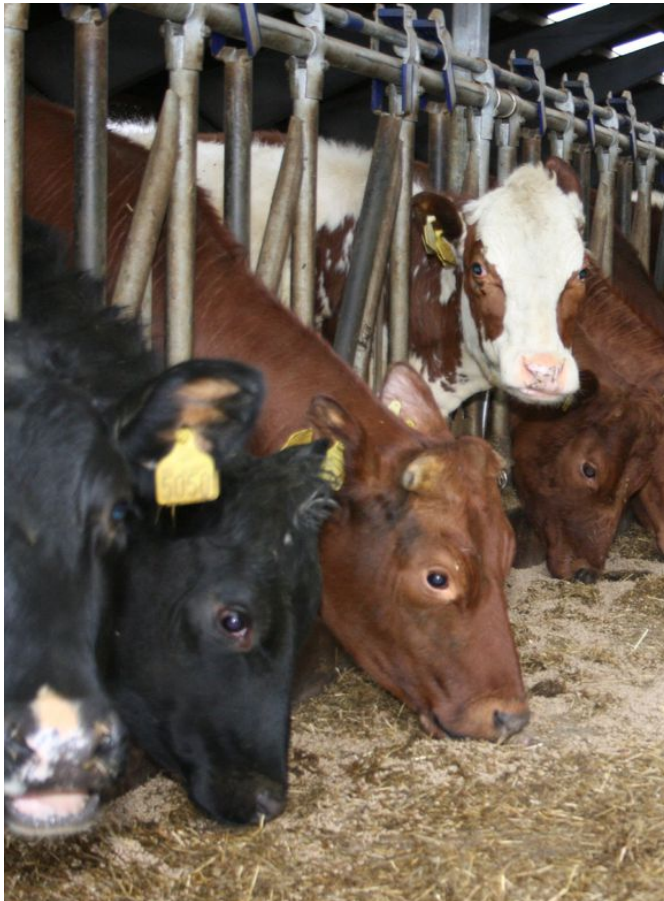
Etter hausten 2022 har pilene stort sett peika nedover for Bondens prisindeks (BPI).

Kraftfór er ein av dei desidert største kostnadene for norske bønder. I år reknar Budsjett-