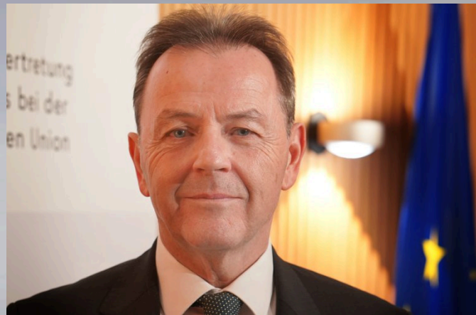
Nikolaus Berlakovich er bonde, og sitter i parlamentet i Østerrike for partiet det Østerrikske Folkeparti (ÖVP), som tilsvarer Høyre i Norge.