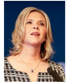
Frp-leder Sylvi Listhaug mener det er behov for store endringer i norsk landbrukspolitikk.

ner per tonn høgare nå enn i april 2021, seier han.