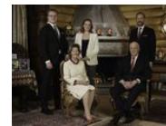
Ingen familiekonflikter her

Alle fedre burde hatt en ansatt som skriver alt de skal si til barna sine.