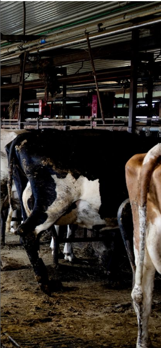
er enno uvisst.

Inntektene søkk, gjelda stig og krava om investeringar er store. Mange pilar peikar i feil retning for bøndene.