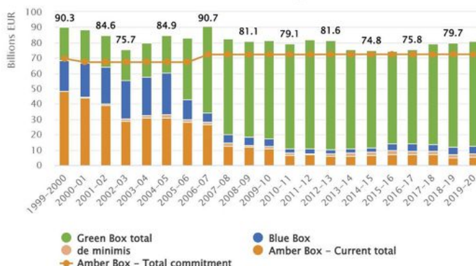
WTO-RAPPORTERING: Her er støtta som EU har rapportert inn til WTO i såkalla grøn, blå og gul boks. Streken er EUs tak i gul boks.