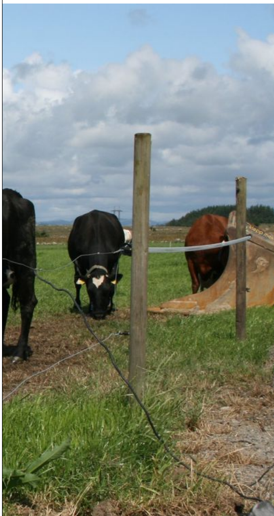
fast på forslaget.