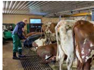
Økning: Bondens Prisindeks (BPI) økte med 2,2 prosent fra august til september.

Prisindeksen er laget av Agri Analyse og tar for seg prisene på