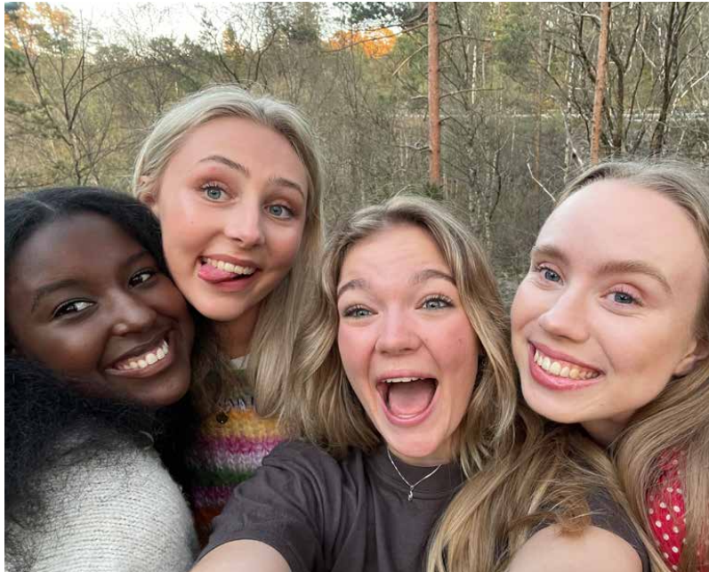
Enormt populært: – Folkehøgskole er enormt populært, og det gir oss en ekstra stor forpliktelse til å sørge for et godt tilbud og en god styring av sektoren, sa kunnskapsminister Tonje Brenna (Ap) da hun mottok den nye NOU-rapporten om folkehøgskolen. Her samholdt mellom elever på Bømlo folkehøgskole.

til økt livsmestring og mangfold, og være åpen for alle.