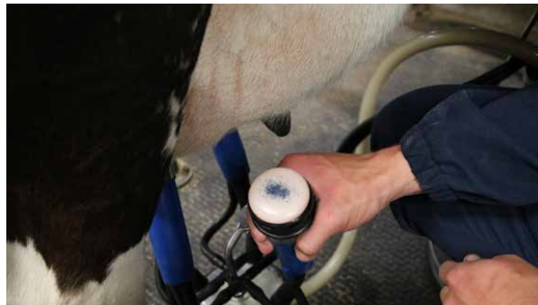
Kvoteseal: Dei to siste åra har salet av mjølkekvote bremsa kraftig opp. Det skjer parallelt med krav om at ein større del av kvoten må seljast til staten til ein lågare pris enn ein kan få i marknaden.