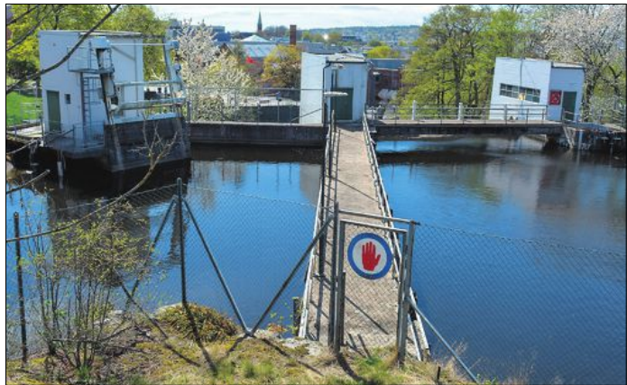
HIT, MEN IKKE LENGRE: Fra dammen over Mossefossen.

Sør-Norge har vært gjennom den tørreste mars-april-perioden på over 100 år og langs Mjøsa står båtforeninger på bar bakke.