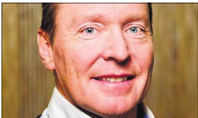
REGN: Norske matbønder er helt avhengig av at det snart kommer regn til avlingene deres.

Sammen med rekordhøye priser på gjødsel kommer skyhøye priser på diesel, strøm og kraftfôr. Dermed har kostnade-