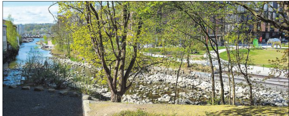
TØRT: Mosseelva ned mot Mossesundet.