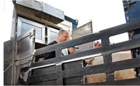
Slaktebilen rygger inn på gårdstunet på Hovde gård.