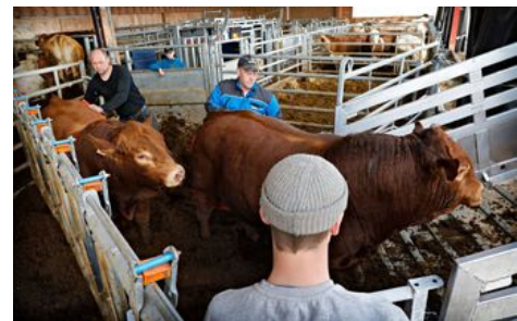
Kyrne og oksene lokkes og dyttes på.