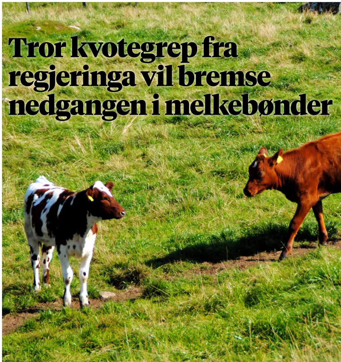
Færre bønder: Antall melkebønder har stupt de siste årene. Nå er spørsmålene om den nye regjeringen kan snu trenden.