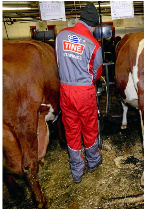
Lavere priser: Redusert kvotetak kan føre til lavere priser på melkekvoter, spår Smedshaug i Agri Analyse.

Han tror ikke nødvendigvis det vil føre til at det blir flere små og mellomstore bruk, men at det