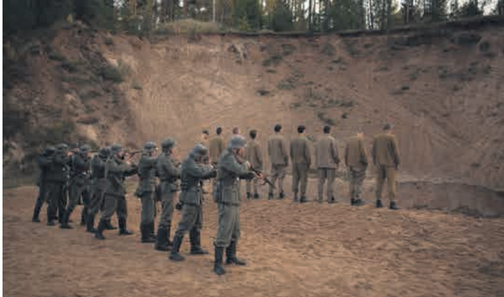
KVA TENKTE NRK? Dramatiseringane i «Frontkjempere» skapar identifikasjon med nordmenn i SS-uniform, men offera er heilt framandgjorte.