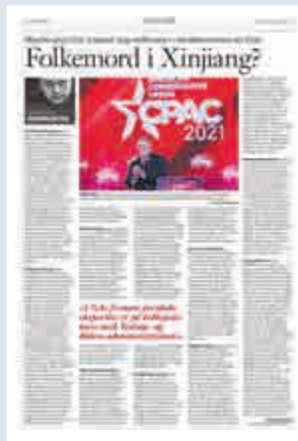
Klassekampen 7. april

Likevel er det kanskje juridisk sett for få vitnesbyrd til å erklære et pågående folkemord, og fortellingene er umulig å verifisere helt sikkert. For å komme nærmere en udiskutabel situasjonsbeskrivelse, går jeg til offisiell kinesisk statistikk. Den viser at fødselsraten i Øst-Turkestan stupte fra 15,88 promille i 2017 til 8,14