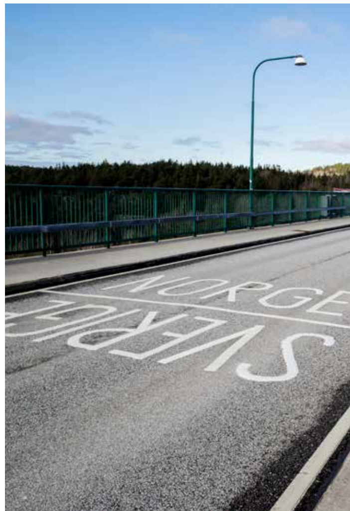
Grensehandel: Nordmenn handlet mer i Norge som følge av stengte grenser. Størst var forskjellen i regioner ved grensa til Sverige.

Grafikk: Bjarne Bekkeheien Aase, Nationen