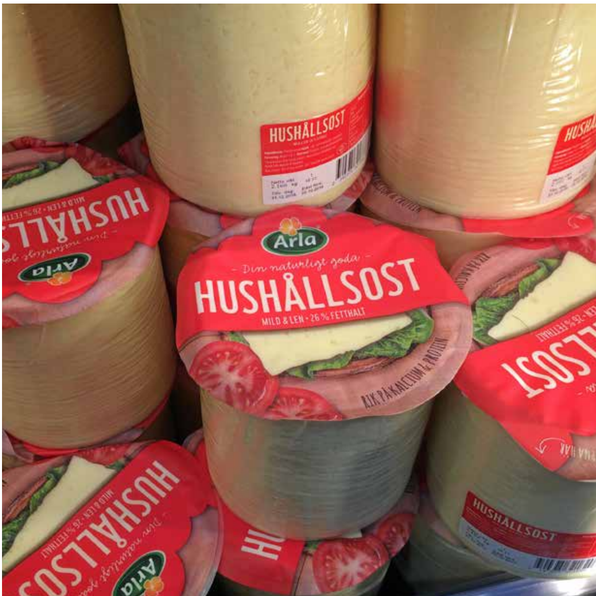
Ostekollaps: Den svenske osteproduksjonen har gått ned frå 128.000 tonn i 1995 til 81.000 tonn i 2019. Importen av ost har på omtrent same tid auka frå 25.900 tonn i 1996 til 141.000 tonn i 2019, ifølgje AgriAnalyse.

sju land. Rundt ein firedel av bøndene er svenske og hovudkontoret til Arla er i Danmark.