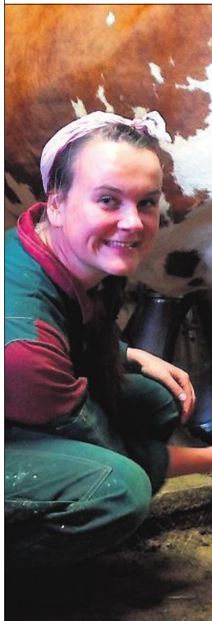
er sier, er det ingen grunn til å tro at

av januar, foreslår å kutte jordbruksutslipp med 5,1 millioner tonn. Den slår blant annet fast at redusert kjøttinntak og kjøttproduksjon kan føre til store ut-