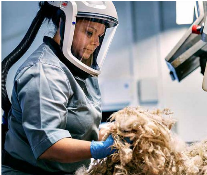
Ny ullpris: Fra 1. september er prisen fra Norilia til produsent satt til null kroner.

– Samtidig har etterspørselen etter økologiske produkter også vært økende i Norge. I 2018 la regjeringen la fram en nasjonal strategi for økologisk jordbruk for perioden 2018–2030. Da fastsatte vi et nytt mål for utviklingen på området: Vi skal stimulere til økologisk produksjon som er etterspurt i markedet. Å sette et prosentmål for økologisk produksjon som ikke henger sammen med etterspørselen, mener jeg er uklokt. Jeg er opptatt av at norsk jordbruk skal ha mulighet til å produsere økologisk mat i tråd med etterspørselen og markedspotensialet for økologiske produkter, skriver Olaug Bollestad. ■