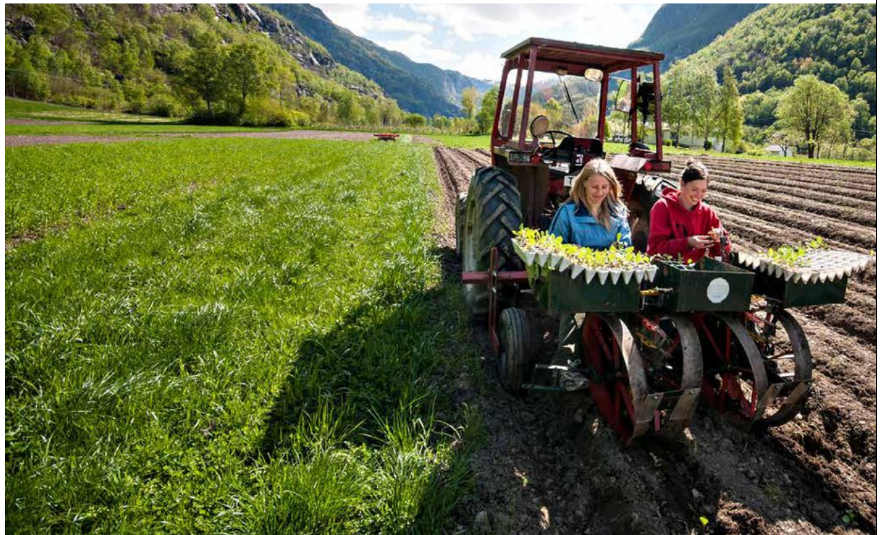
Forskjell: I Norge er 4,2 prosent av jordbruksarealet økologisk. I Sverige er andelen 20,4 prosent. Nå skal utviklingen være etterspørselsdrevet. Bildet er fra Aurland.