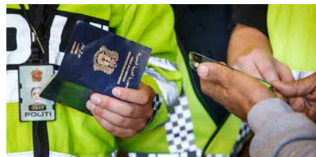
Bortvist: Politiets utlendingsenhet rapporterer at 2.015 personer har blitt bortvist fra landet i henhold til smittevernloven fram til august.