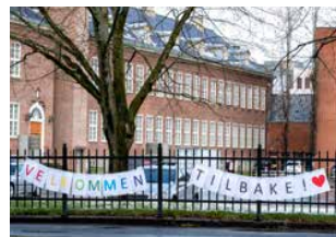
IB: Trondheim katedralskole er en av skolene i Norge som tilbyr IB-program.

– Vi vil komme med et endelig vedtak i saken først etter at vi har vurdert IBOs eventuelle kommentarer til varselet, opplyser tilsynet. ©NTB