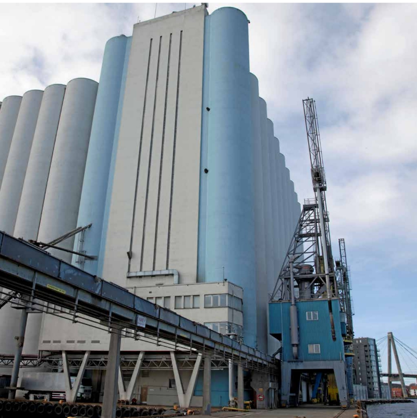
Havnesilo, er eid av Felleskjøpet Agri. Her ønsket flere partier å ha et statlig eid beredskapslager for korn.