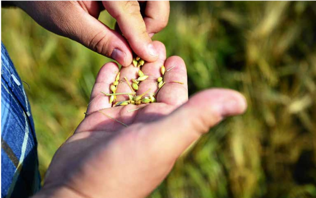
Bygdemagasiner: På 1800-tallet hadde bygder rundt omkring egne bygdemagasiner hvor korn ble lagret.