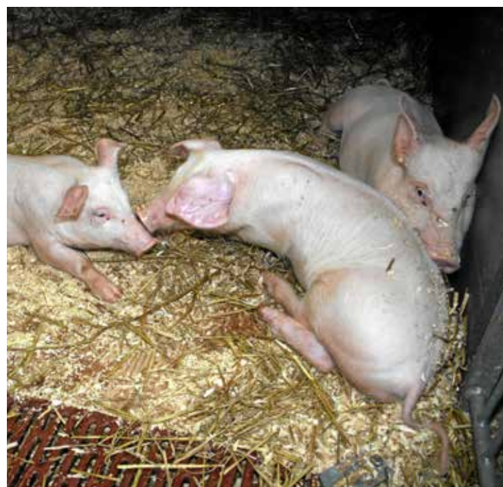
Ubalanse: Det er stort overskot av norsk svinekjøtt for tida, men over tid kan ikkje importkvotane på svin stå ubrukt ifølgje landbruksanalytikar.