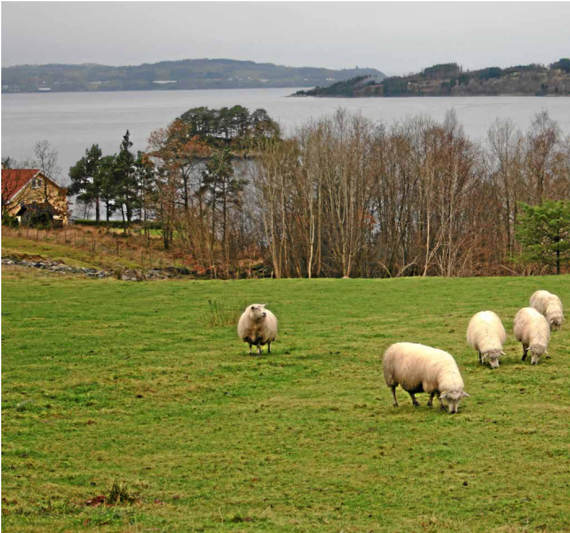
Avtalar: Norge har avtalt kvoteimport på over 1200 tonn kjøtt frå sauer og lam. Her frå øya Ombo i Ryfylke i Rogaland.