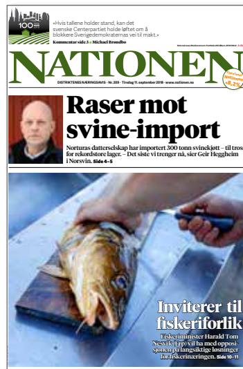
Nationen 11. september.