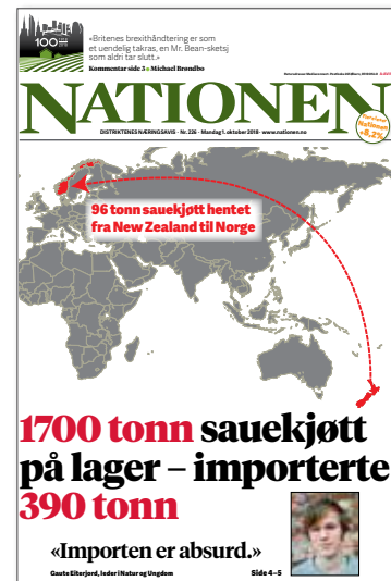
Nationen 1. oktober.