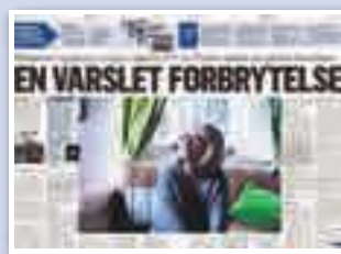
Klassekampen 10. mars

■ I denne artikkelen belyser Klassekampen at Norge både har en styrtrik stat, samtidig som gjeldsnivået blant husholdningene og private bedrifter er verdens høyeste.