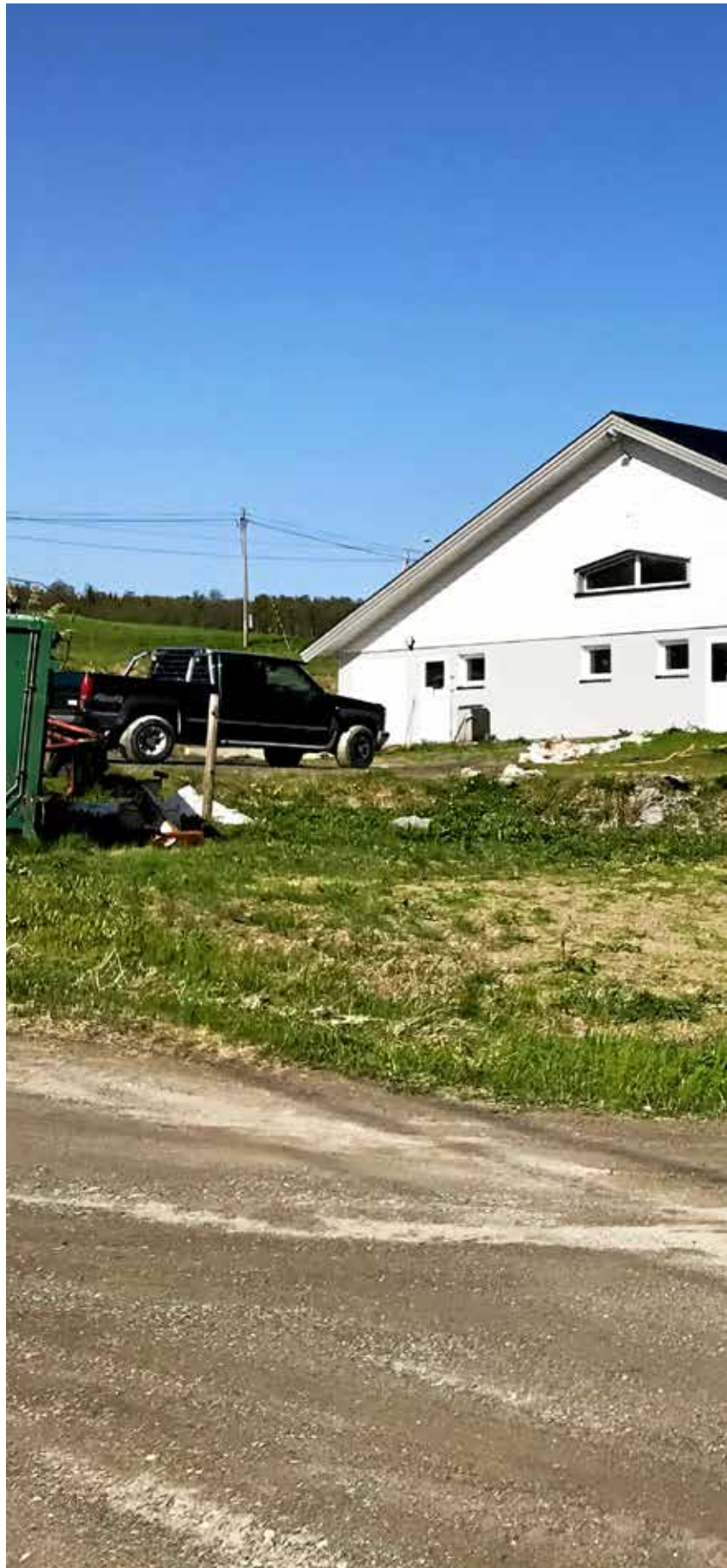
Konkurs: Slåttnes gård i Tromsø er selt etter at eigaren gjekk konkurs. Det er blei bygd i 2012.

Bjarne Bekkeheien Aase bjarne.aase@nationen.no