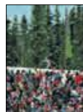
OL i 1994

De nordiske opinionsmålerne fant ut at 55 prosent av nordmen-