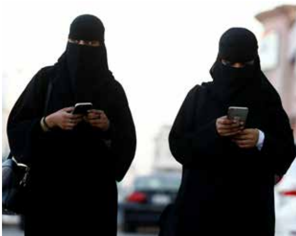
Kvinner i Saudi-Arabia har ikke samme rettigheter eller opplever likestilling, slik som kvinner i Vesten gjør.

45 prosent av bøndene tror gården består i driftsmessig forstand om 50 år, mens bare 23 prosent svarer nei, ifølge en undersøkelse foretatt av Agri Analyse for Landbruksforsikring. (NTB)