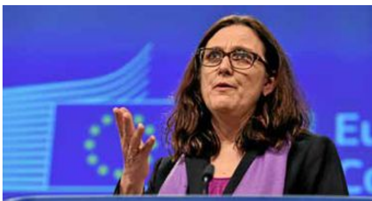
Forhandlinger: EUs handelskommissær, Cecilia Malmström, har forhandlet med USA om TTIP-avtalen.