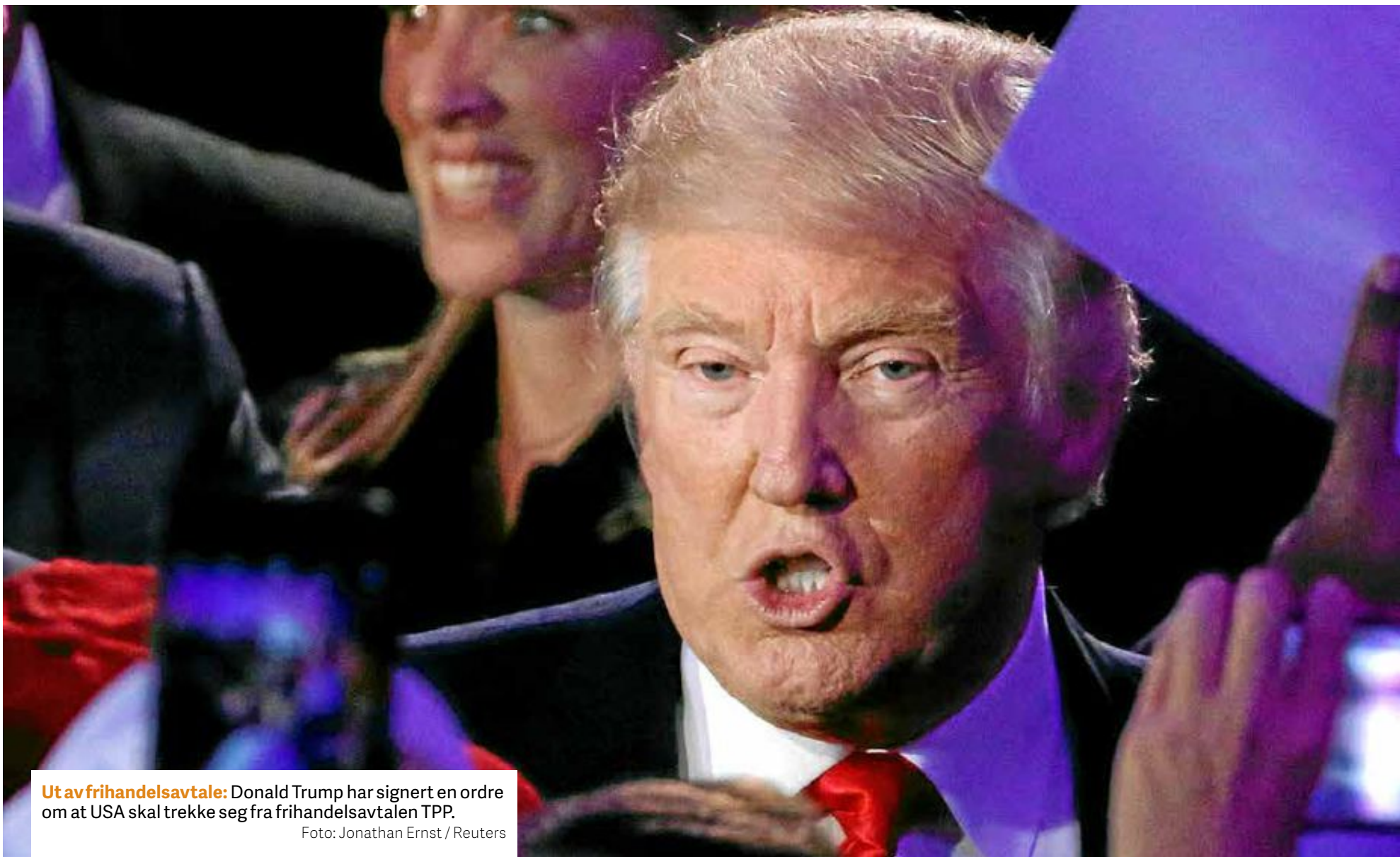
Ut av frihandelsavtale: Donald Trump har signert en ordre om at USA skal trekke seg fra frihandelsavtalen TPP.