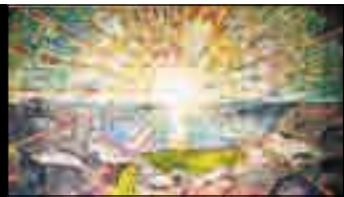
Edvard Munch: «Solen» ©Munch-museet/Munch-Ellingsen gruppen/BONO

Profittjag gir dårligere velferdstjenester. Men hva med de ansatte?